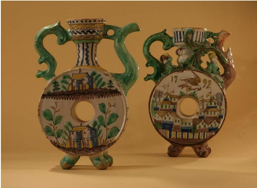
Квасники. Гжель 18 век