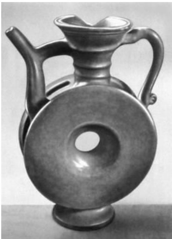
Чёрный лощёный квасник. 18 в. Исторический музей. Москва.

Керамические квасники часто украшались резьбой или расписывались сценами битв или охоты, изображениями людей, животных, зданий.