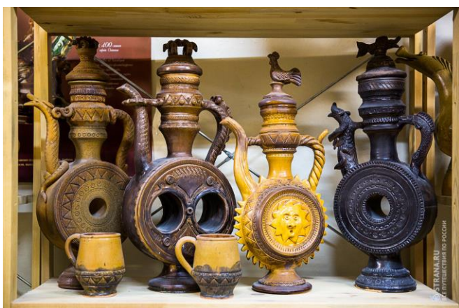
Квасники. Скопинская керамика